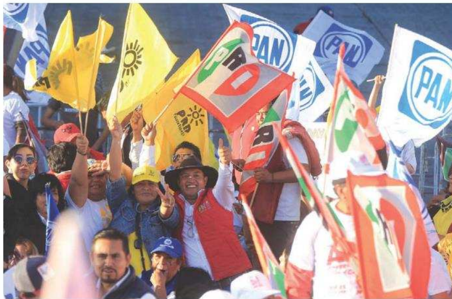
Consejeros electorales se manifestaron a favor de una contienda de propuestas. IVÁN CARMONA

También se manifestaron por que sean votos informados, por