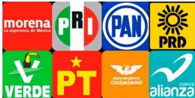
Inician campañas en el Estado de México.

De igual forma, a la par de las candidaturas individuales, se han conformado dos candidaturas comunes y dos coaliciones. La candidatura común "Seguiremos Haciendo Historia en el Estado de México" está integrada por More-