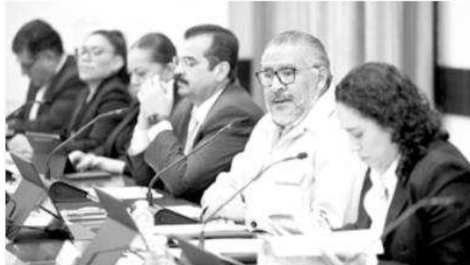
Titular de la Secretaría General de Gobierno (SGG) en la entidad, Horacio Duarte Olivares.

El funcionario reiteró el compromiso del Gobierno Estatal para trabajar en coordinación con el Instituto Nacional Electoral (INE); el Instituto Electoral del Estado de México (IEEM) y la Fiscalía General de Justicia del Estado de México (FGJEM), así como con las