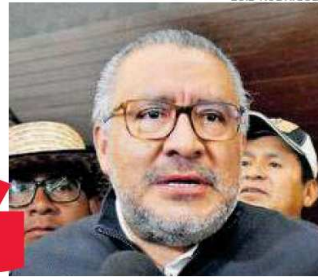
HORACIO DUARTE SECRETARIO GENERAL DE GOBIERNO

“Existe la necesidad de intensificar las medidas de seguridad para que no ocurran hechos como los de Amanalco e Ixtapaluca”