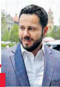
ANUAR AZAR FIGUEROA LÍDER DEL PAN

“Pedimos que el actuar del gobierno sea imparcial, que no se manipulen los programas sociales y expreso mi confianza en el IEEM”